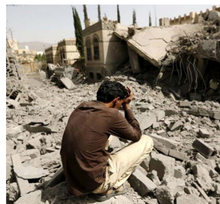
Según la ONU, hay más de 9 mil muertos y 22 millones de personas que necesitan asistencia debido a la guerra en Yemen. De estos, 8,4 millones padecen hambruna.

Catar expresó su esperanza de que ambas partes continúen implementando las próximas etapas del cese de las hostilidades, lo que contribuiría a facilitar el acceso a la asistencia humanitaria.