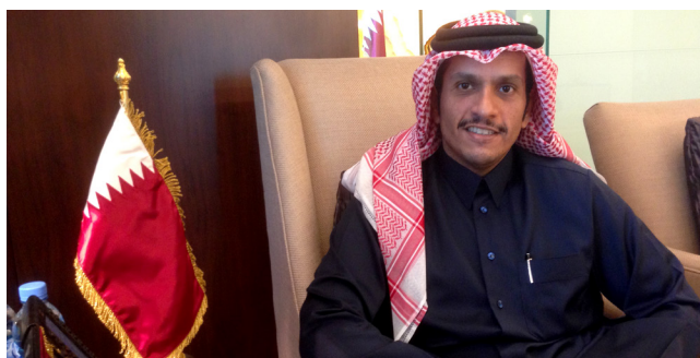
S.E. Viceprimer Ministro y Ministro de Relaciones Exteriores Jeque Mohammed bin Abdulrahman Al-Thani.

Asimismo, S.E. afirmó que Turquía, Irán e Iraq son miembros importantes de la región, por lo que Catar debe tener relaciones positivas y constructivas con ellos, no tanto por el bloqueo, sino porque mantener relaciones de amistad con todos los países del área es parte de la estrategia nacional. El Ministro señaló que pueden existir diferencias con esos países, pero Irán y Catar comparten zonas de gas; es más, la nación