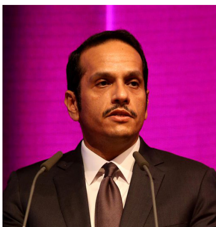
S.E. Viceprimer Ministro y Ministro de Relaciones Exteriores de Catar.

persa abrió su espacio aéreo cuando los del bloqueo cerraron los suyos. Por lo tanto, los vínculos con todos son importantes, si bien Catar permanece abierto con y sin la crisis del CCG. Finalmente, S. E. expresó la esperanza de que los países autores del bloqueo vuelvan a la razón, se comprometan con su región y resuelvan el problema.