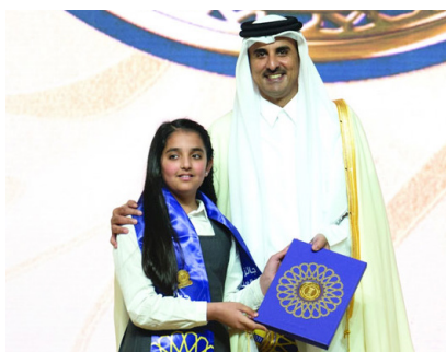
S.A. el Emir con una de las galardonadas.

S.A. el emir Jeque Tamim bin Hamad Al-Thani patrocinó la 12ª edición de la ceremonia de entrega del Premio al Día de Excelencia en la Educación, que tuvo lugar en el Hotel Sheraton de Doha el 3 de marzo. Asistieron al evento varios jeques, ministros, jefes de misiones diplomáticas acreditados, funcionarios de educación superior y padres de los estudiantes e investigadores destacados.